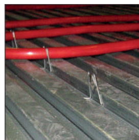
Leidingen blijven te verschuiven