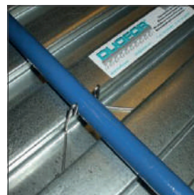
Druk slang in de DuoKlip