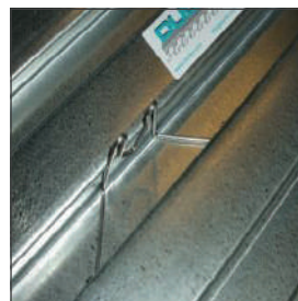
Druk de klip goed in