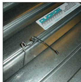
Haak in het profiel

De Duofor DuoKlip biedt dé oplossing voor het monteren van de veelvuldig toegepaste vloerverwarming in zwaluwstaartplaatvloeren. Bestaande beugels die middels zelftappers direct aan de metalen zwaluwstaartplaat worden geschroefd vragen veel arbeidshandelingen. Deze moet men stuk voor stuk over de weerbarstige slang beugel - moet positioneren. Daarnaast zijn ze niet flexibel in het geval van verandering van het leidingplan.