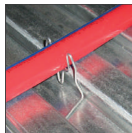
Geschikt voor Ø 12-20 mm

Note: Voor meer vloerdetails, raadpleeg Duofor B.V.