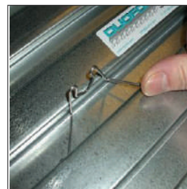
Klik in het profiel